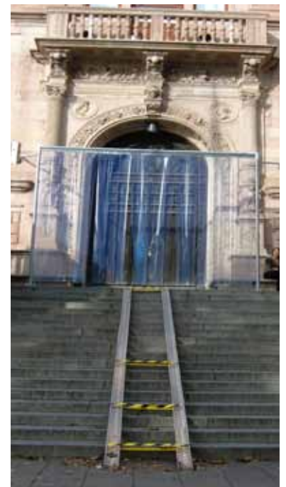
Konstakademiens installationsramp till huvudentré

Gladmålade transportlådor som blickfång i Moderna Museets entré