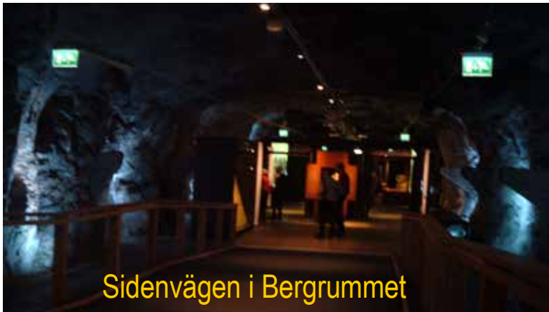
Sidenvägen i Bergrummet

= en spännande 'resa' för alla åldrar till Kina för ett par tusen år sedan. Tillgängligheten är god för rullstolar etc. i lokalen, men de med nedsatt syn kan ogilla mörkret runtom.